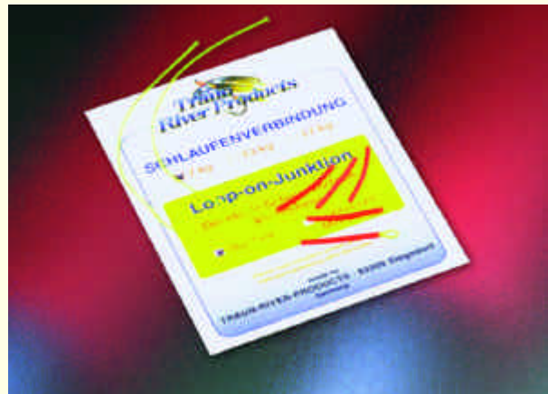
Traun River Products Full-Funktion-Vorfächer

Tragkraft 16 kg Artikel-Nr. 10-0025-16 € 8,90